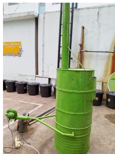
Gambar 3. Hasil Jadi Alat Pembakaran Sampah Minim Asap