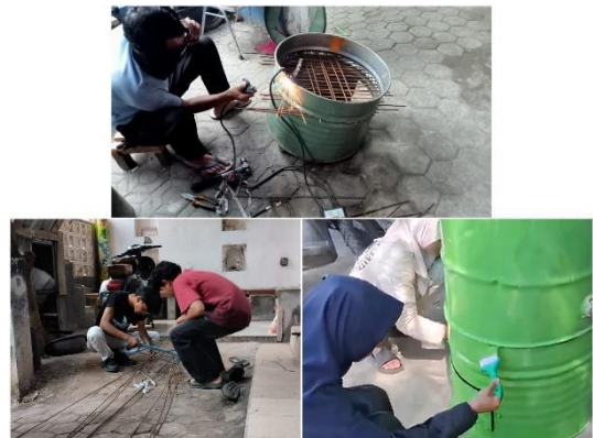
Gambar 2. Proses Pembuatan Alat Pembakaran Sampah Minim Asap